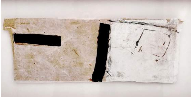
Jean-Louis Espilit Sans Titre Lithographie rehaussée sur papier népalais et marouflée sur jute. 18 x 45 cm 1990