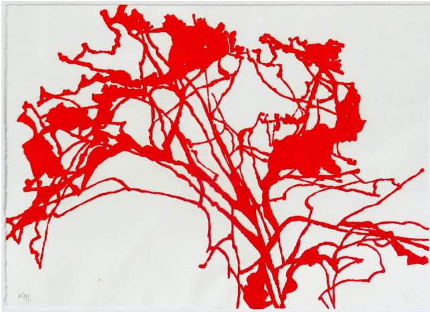
Alexandre Hollan Sans titre Lithographie 35 x 50 cm 2012