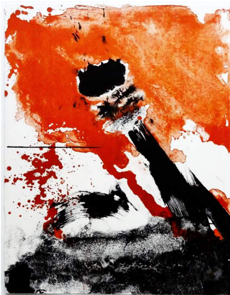
Serge Saunière Vive la couleur Lithographie 65 x 50 cm 1977 Atelier Pousse Caillou